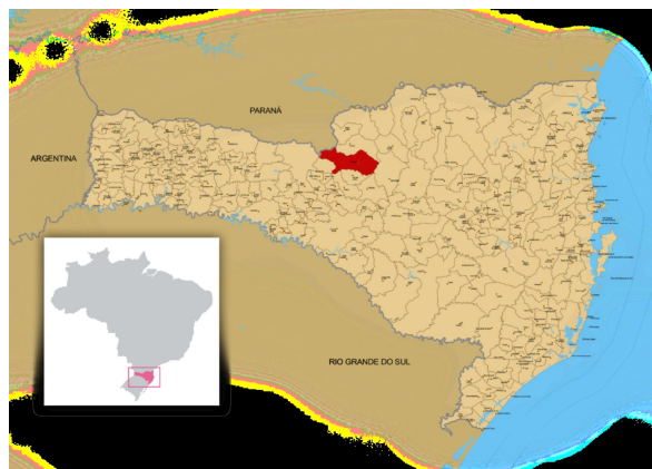
Figura 1 – Localização do Município de Caçador em Santa Catarina.

O município de Caçador pertence a microrregião de Joaçaba, a qual, por sua vez, é pertencente a mesorregião Oeste Catarinense. A microrregião possui uma área total de 9.136,383 km 2 , e está dividida em 27 municípios: Água Doce; Arroio Trinta; Caçador; Calmon; Capinzal; Catanduvas; Erval Velho; Fraiburgo; Herval d'Oeste; Ibiam; Ibicaré; Iomerê; Jaborá; Joaçaba; Lacerdópolis; Lebon Régis; Luzerna; Macieira; Matos Costa; Ouro; Pinheiro Preto; Rio das Antas; Salto Veloso; Tangará; Treze Tílias; Vargem Bonita; Videira.