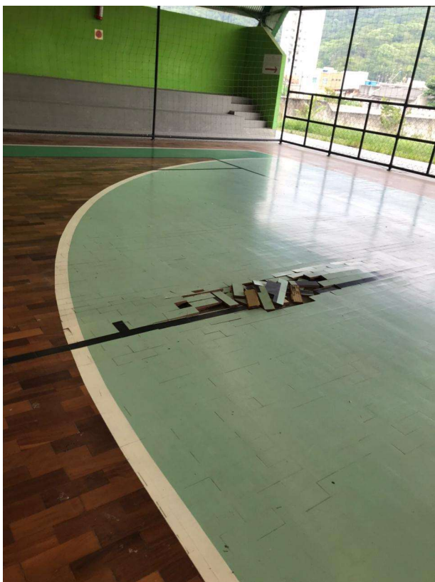
Figura 01 – Descolamento de tacos no câmpus Itajaí, vista 01.

As quadras poliesportivas nos câmpus Itajaí e Gaspar necessitam de manutenção corretiva, ou seja, reparos pontuais em seus pisos em tacos de madeira . Em vistorias presenciais recentes, constatou-se o descolamento dos tacos, conforme figuras abaixo.