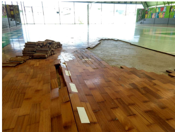
Figura 04 – Descolamento de tacos no câmpus Gaspar, vista 02.