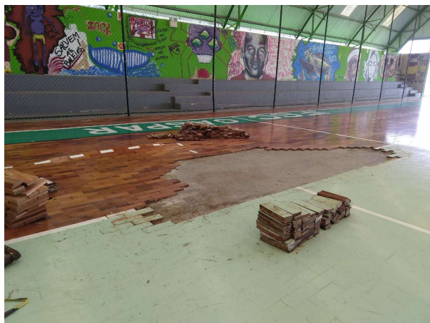
Figura 03 – Descolamento de tacos no câmpus Gaspar, vista 01.